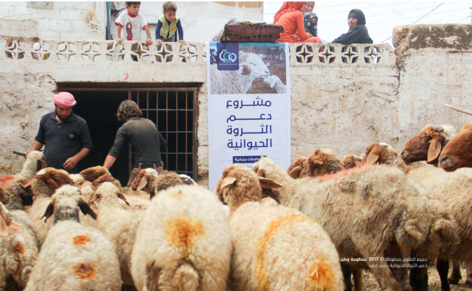
جميع الحقوق محفوظة © منظمة وطن دعم الثروة الحيوانية - ريف إدلب