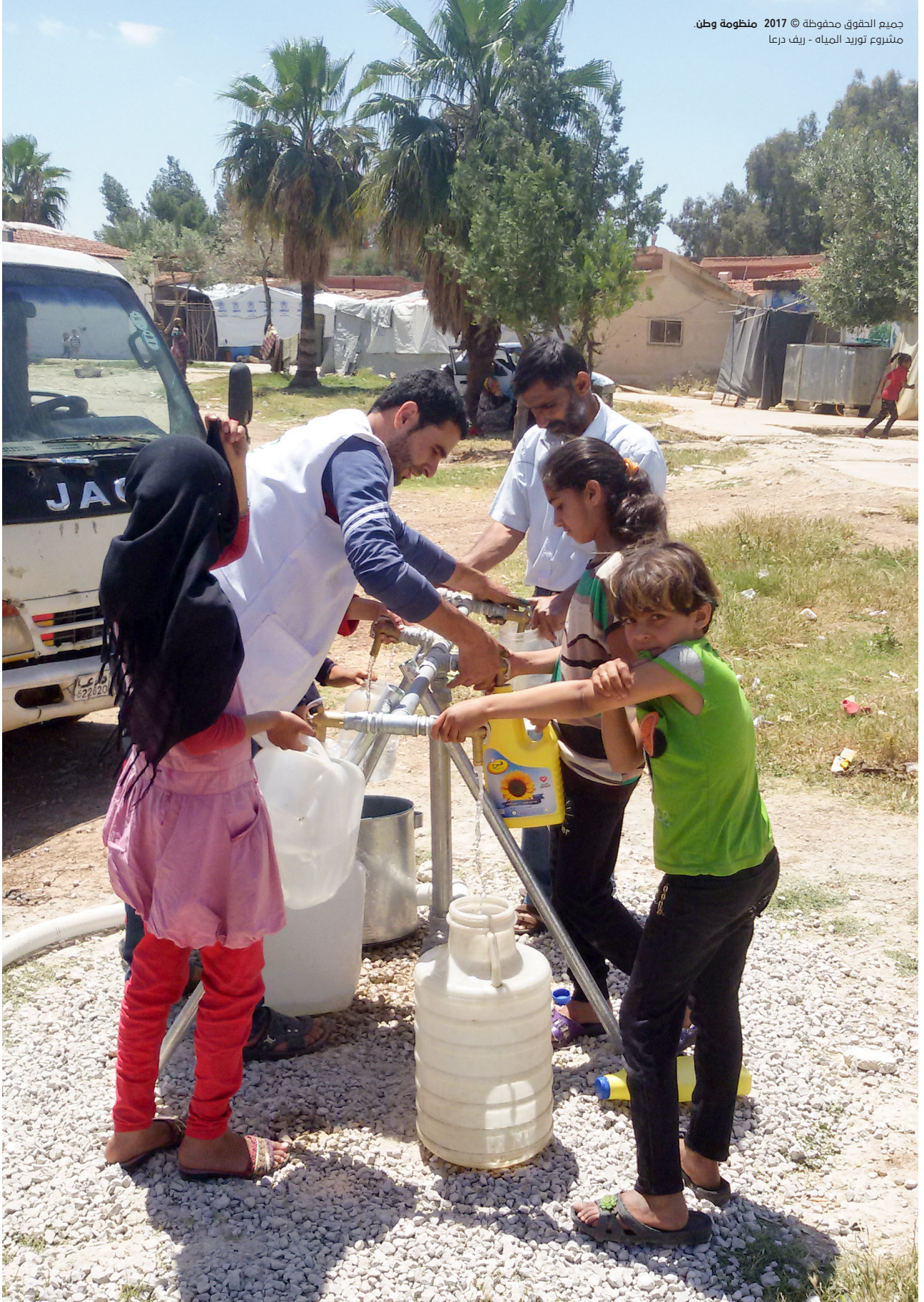
مشروع توريد المياه - ريف درعا